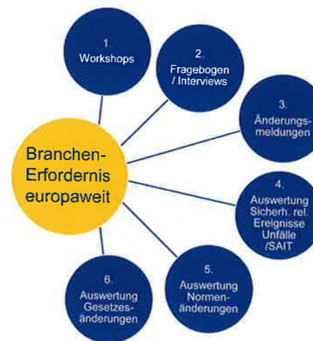
Ermittlung der Branchenanforderungen.

Neben dem schon genannten „pool of experts“ baut die VERS ein Beratergremium auf, das aus voraussichtlich acht Mitgliedern bestehen wird. Davon je zwei aus den Bereichen der ECM, des Return of Experience, der Werkstattauditoren und Werkstattvertreter. Nur einer von den beiden Vertretern soll Deutsch als Muttersprache haben, der zweite hingegen im europäischen Ausland beheimatet sein. Die wesentliche Aufgabe dieses Beratergremiums wird sein, alle Änderungen an oder Neuerstellungen von Modulen des VPI-European Maintenance Guide (VPI-EMG) auf technische Richtigkeit und Verständlichkeit zu prüfen, aber auch auf ihre Umsetzbarkeit in den Werkstätten. Dabei können und sollen diese Experten auf die Erfahrung und das Fachwissen der technischen Fachgruppen zurückgreifen, aus denen sie entsandt werden.